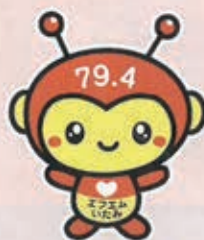
エフエムいたみ マスコットキャラクター ななきよん